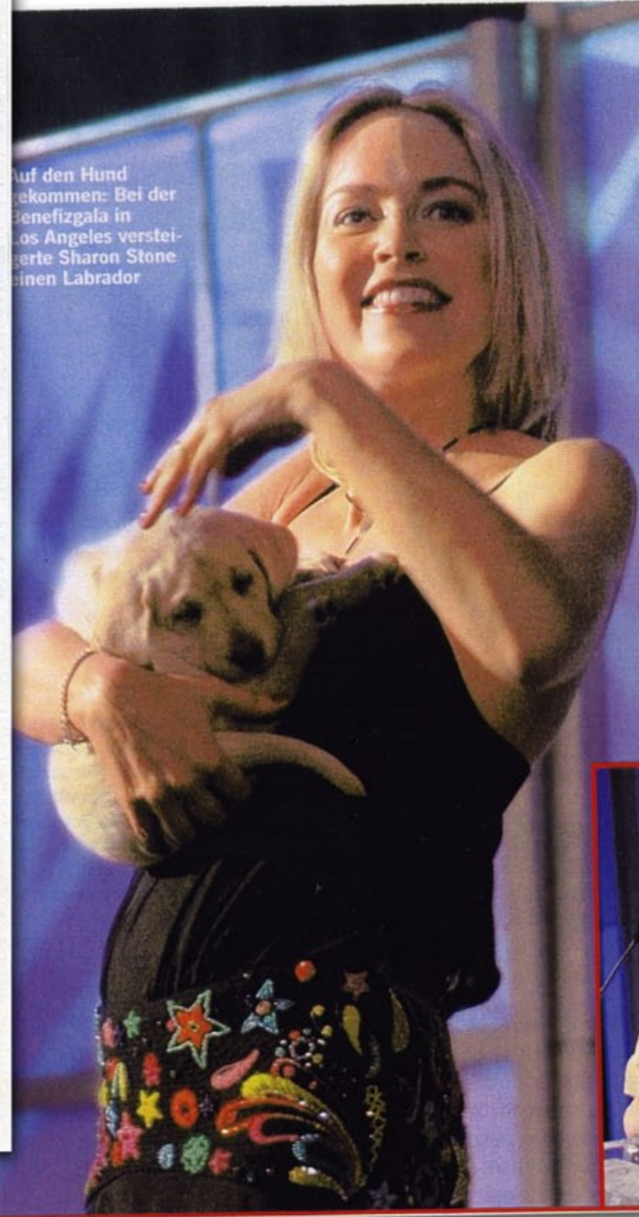
Auf den Hund gekommen: Bei der Benefizgala in Los Angeles versteigerte Sharon Stone einen Labrador

Langfinger Winona Ryder gibt's jetzt auf Weihnachtskarten unter www.bettybowers.com (6 Stück 14,99 $)